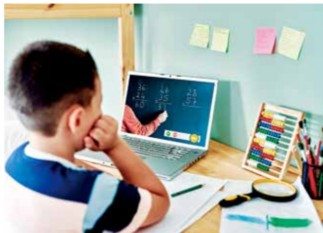
孩子在利用在线学习软件上课。

度上延缓了德国教育体系的现代化进程。如今，德意志联邦共和国不仅允许所有学校都使用 HPI 平台，还鼓励学校充分发挥数字学习的优势。