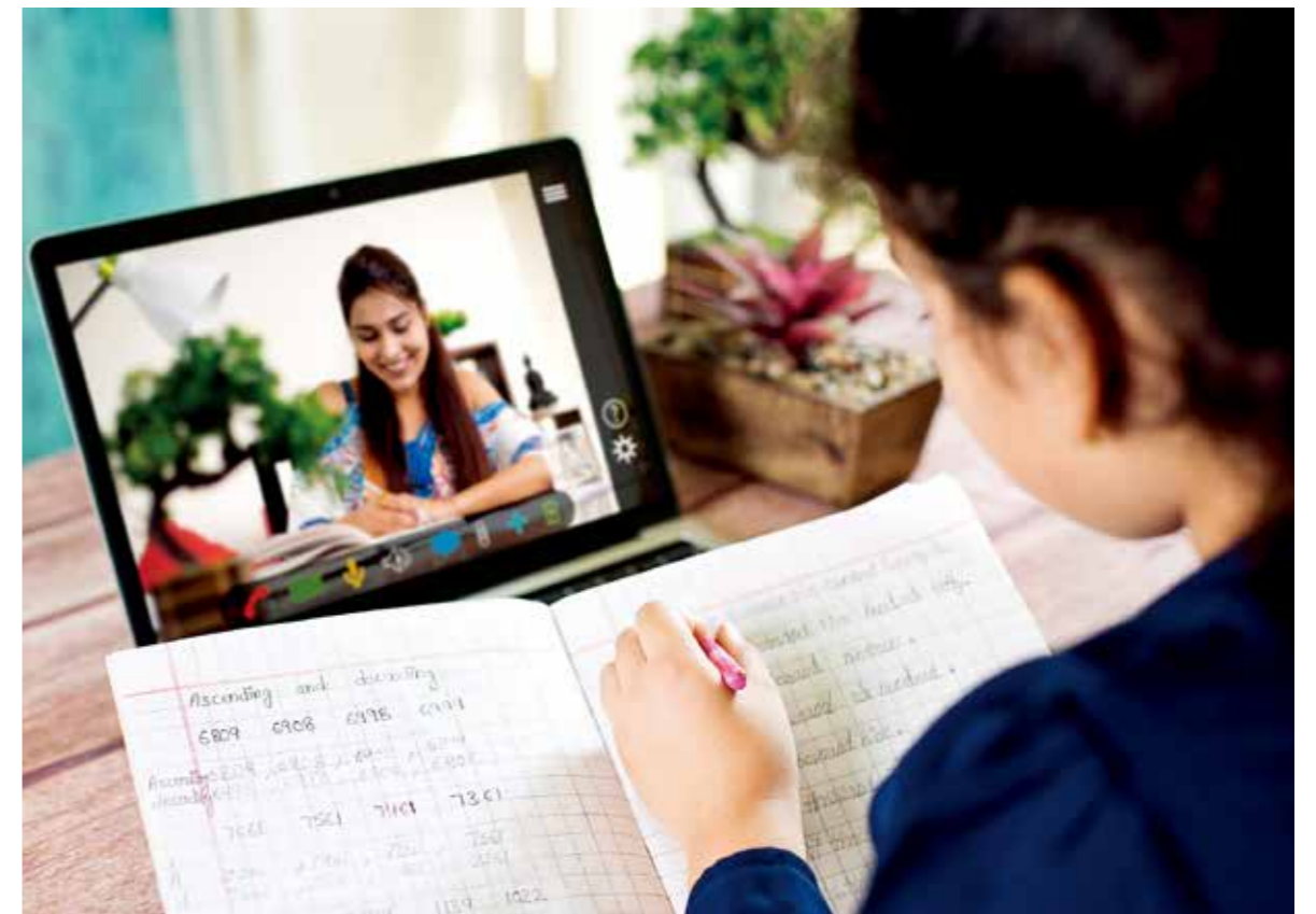
学生通过在线学习平台进行远程上课。